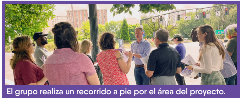
El grupo realiza un recorrido a pie por el área del proyecto.