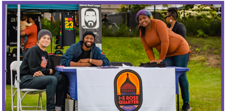
Empleados del proyecto asisten a la celebración del 50 aniversario de Juneteenth Oregon.

El equipo del proyecto está trabajando actualmente en una evaluación ambiental debido a los cambios de diseño del concepto propuesto de la cubierta. Hará un periodo de comentarios públicos de 30 días en el otoño de 2022 e incluirá una jornada de puertas abiertas en línea. Se espera una decisión sobre el proyecto de la Administración Federal de Carreteras a principios de 2023.